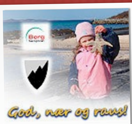
GOD, NÆR OG RAUS

Utviklingskveldene avholdes i lokale skoler og grendehus. Ta kontakt med rektor på din skole, dersom du vil vite mer. Eller kontakt egne utviklingslag/prosjekter.