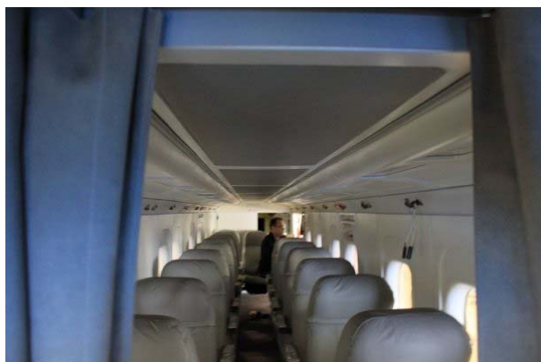
LYR har også fått nye setetrekk i skinn.

- Maskinen fremstår nå som bortimot ny. Vi er meget godt fornøyd med den jobben som har vært utført. Det er nesten så vi nå må be passasjerene om å ta av seg skoene når de kommer inn i flyet - men der går vel kanskje grensen, smiler han.