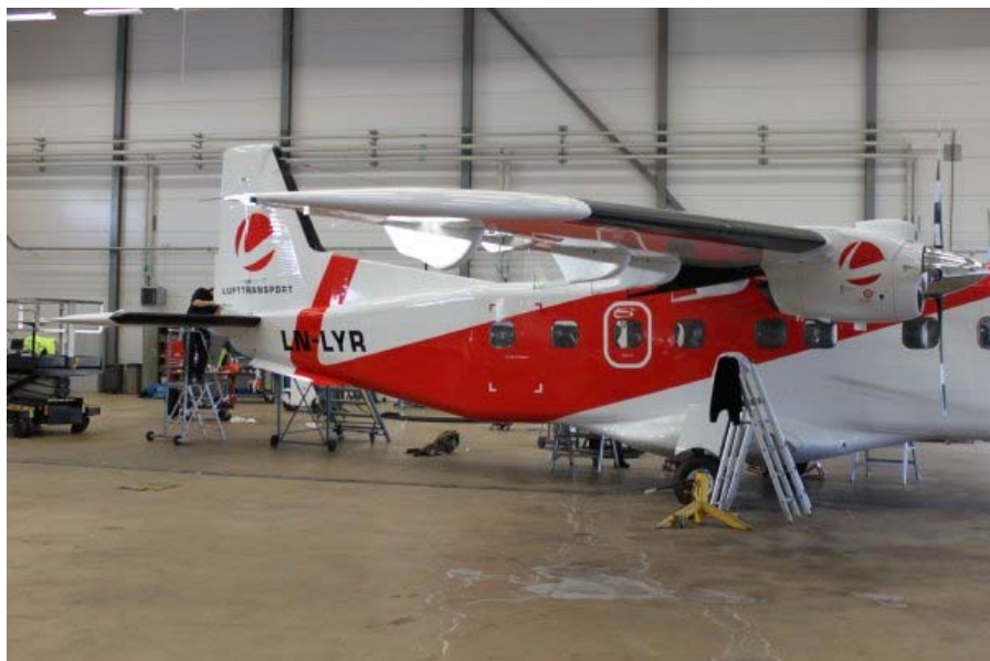
LN-LYR er nylakkert i Lufttransport farger rødt og hvitt.

Etter planen skal "nye" LYR komme tilbake til Longyearbyen onsdag i denne uken.