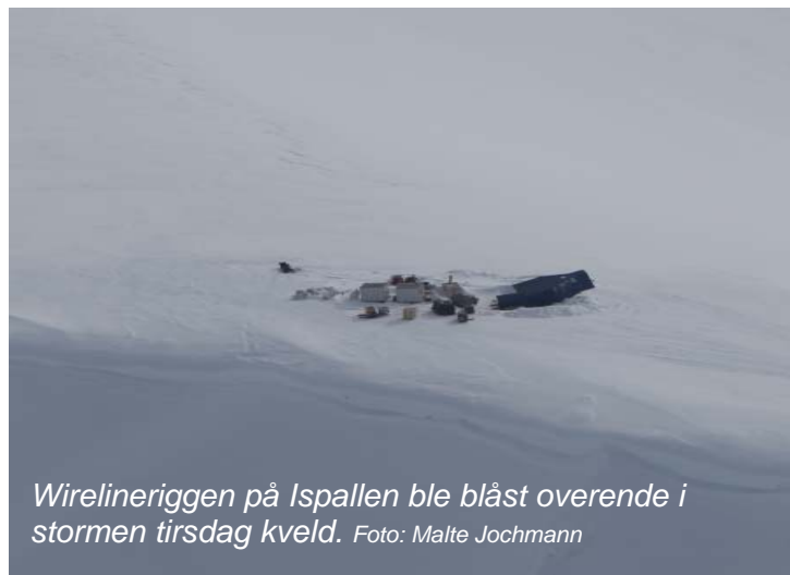
Wirelineriggen på Ispallen ble blåst overende i stormen tirsdag kveld.

Borehullet på Lunckefjell var ikke avsluttet tirsdag kveld. Etter en befaring onsdag kunne geologen imidlertid stoppe boringen uansett og erklære hullet for vellykket, da boringen så vidt hadde kommet gjennom Longyearfløtsen, som er hovedfløtsen i Lunckefjell.