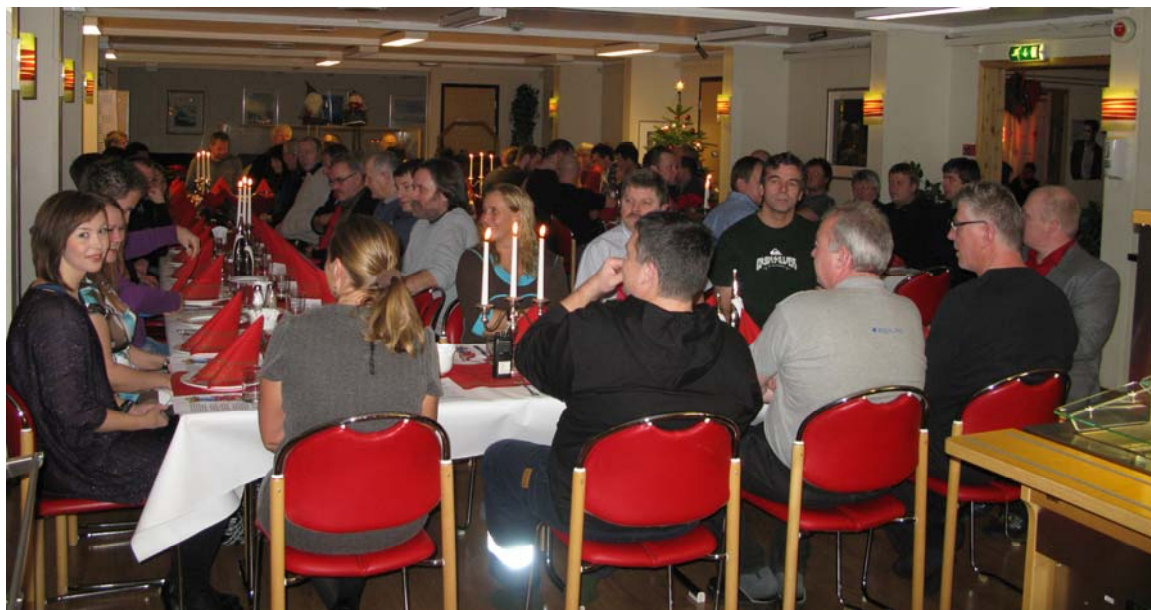
Messa i Svea var pyntet og dekket til julemiddag for alle som var på jobb i julehelgen.

Personalet til ISS sørget for at det ble skikkelig julestemning i Svea på julaften.