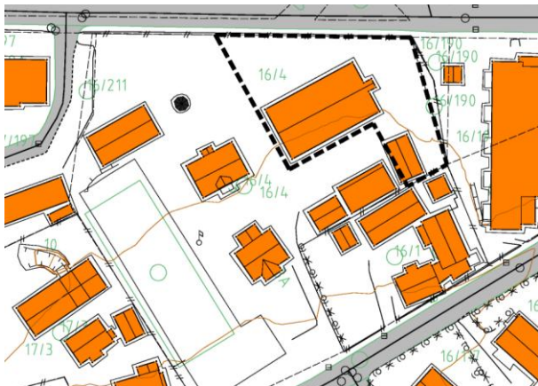
Området for detaljregulering vist med svart stipla strek.

t.d. i høve til evt. krav om utarbeiding av planprogram etter §4-1 og konsekvensutgreiing (KU) etter § 4-2 andre ledd i plan- og bygningslova. Referat frå oppstartmøte er lagt ved dette brevet. Konklusjonen er at det ikkje skal utarbeidast planprogram og at planen ikkje er KU-pliktig, jf. referat.