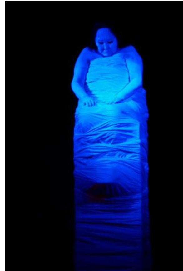
Barents Spetakel 2010 «StarukhY» ved Stepanida