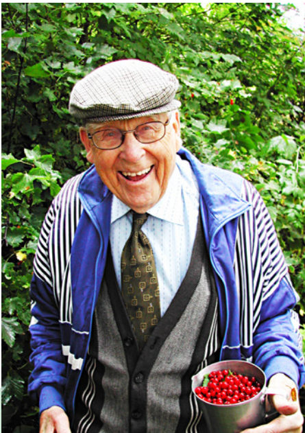
En god kommune å bo og leve i for gammel og ung

Helse – og omsorgstilbudet er en viktig fellesoppgave for kommunen. Stabil tilgang til gode lokale helse-tjenester gir trygghet og må sikres uavhengig av pasientenes ressurser og bosted. Økt satsing på forebyggende helsearbeid er et sentralt virkemiddel for å utjevne helseforskjeller.