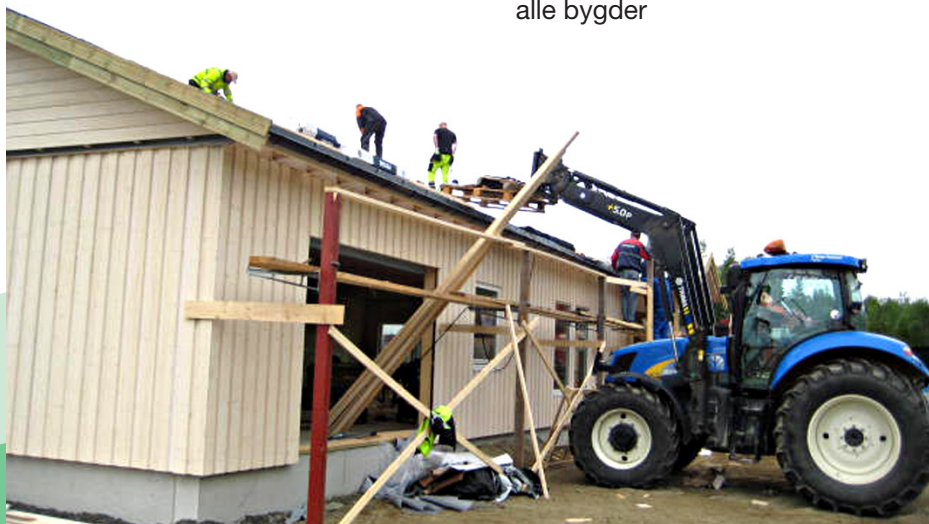
Aktivt dugnadsarbeid i Fiplingdal.