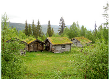
Lisetra – en viktig kulturarv