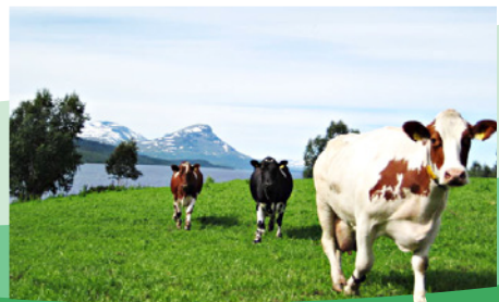
Et aktivt landbruk