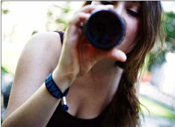
PÅVIRKET: Unge lytter både til foreldre og venner når det kommer til rusbruk, ikke bare venner.

BRUK AV RUSMIDLER (alkohol er det rusmiddelet som er klart mest brukt blant ungdom) er en av farene som dukker opp i ungdomstiden. De fleste foreldre har selv drukkent alkohol i tenåringsdiden, og vet at når man kommer i en viss alder må man ta stilling til å drikke eller å la