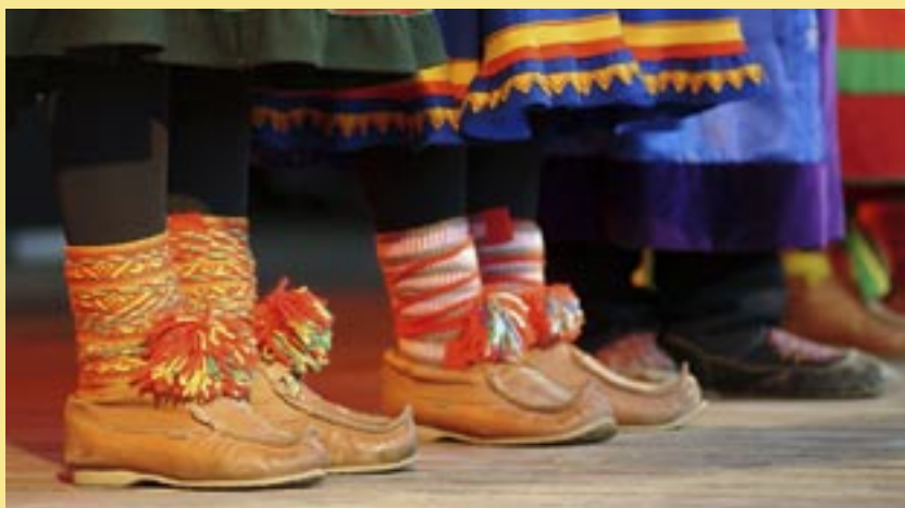
Foto & Grafisk utforming: Riddu Ridđu. • Trykk: Lundblad Media AS