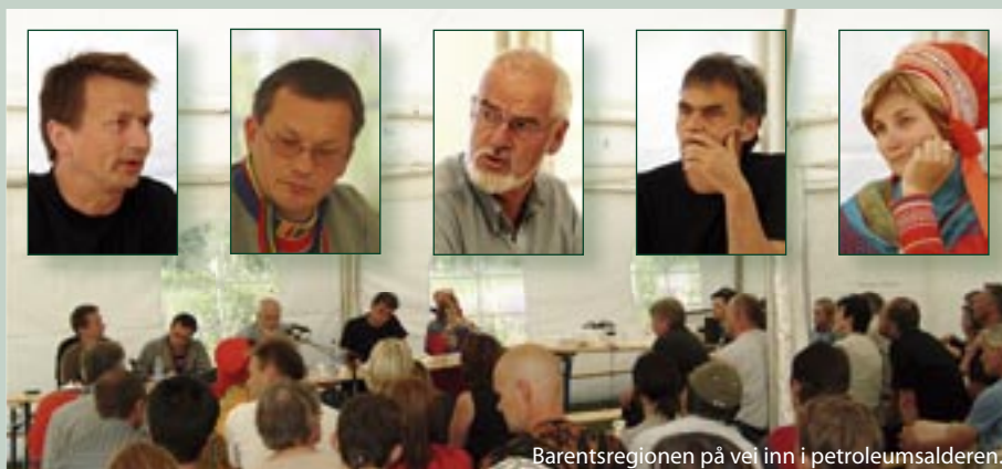
Barentsregionen på vei inn i petroleumsalderen.

Seminarene ble avviklet på Holmenes, i Svartskogen, seminarteltet på Riddu-sletta og i filmsalen på skolen.