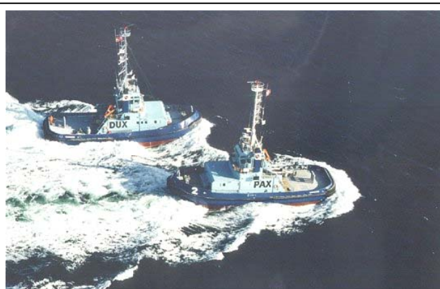
Taubåtvirksomhet er konkurranseutsatt og avhengig av konkurransedyktige rammevilkår. Nettoskatt vil være et virkemiddel for å sikre norske sjøfolk og norsk flagg i næringen.

Som bransjeforening arbeider RLF for å sikre næringen best mulige rammebetingelser. Det er i denne sammenheng fremmet innspill til forvaltningen, den politiske ledelsen i Samferdselsdepartementet og til Stortinget. I tillegg har det vært et aktivt samarbeid med andre aktører i den maritime næringen. I arbeidet med rullering av Nasjonal transportplan deltar RLF gjennom Maritimt Forum. Her fremmes sjøtransportens felles interesser i utformingen av den nasjonale transportpolitikken.