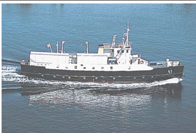
MF Edøy, bygget i 1949, trafikkerer sambandet Molde-Sekken. Gjennomsnittsalderen på norske bilferges er over 20 år. Nye krav til sikkerhet og miljø gjør det nødvendig med en raskere utskifting av dagens fergemateriell enn det legges opp til i NTP 2002-2012.

I Nasjonal transportplan 2002-2012 er det avsatt en økonomisk ramme som tilsvarer nybygg av 1,5 ferge per år i planperioden. Bare for å opprettholde dagens gjennomsnittsalder må det imidlertid bygges fire nye ferges per år. RLF har i møter med Stortingets samferdselskomité og med samferdselsministeren gitt uttrykk for at denne rammen må økes.