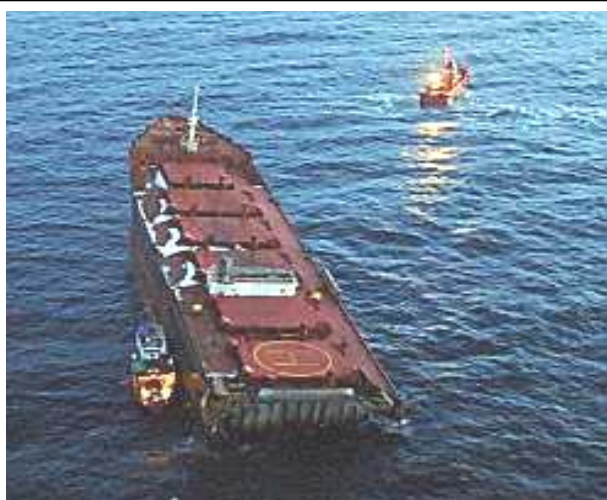
Havarier langs norskekysten har i de senere år skapt omfattende forurensningsproblemer. RLF arbeider for å styrke sikkerheten og beredskapen på kysten.

Medlemskontakten er blant annet opprettholdt gjennom ulike konferanser og annen møtevirksomhet.