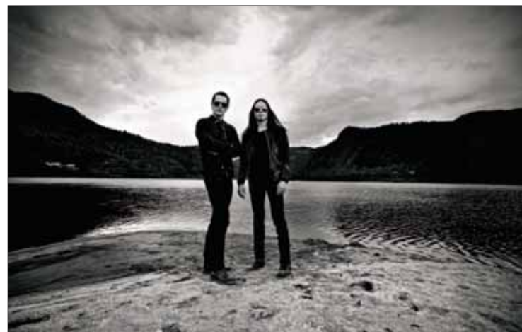
IKKE TIL Å GÅ GLIPP AV: Selv om Satyricon har nok av planlagte turneavtaler verden rundt, hinder ikke det dem fra å sette av tid for å glede Oslo-publikummet under Granittrock.

Som et av verdens største band innenfor sin black metal-