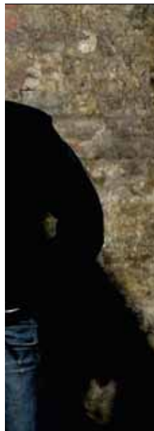
det likevel rolig for seg. Gutta er enige

– Det har vært skikkelig fett å jobbe sammen med folk som man har så mye respekt for. Det føltes helt naturlig for oss, og vi