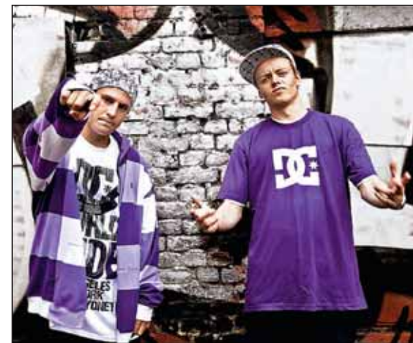
KVELD I RAPPENS TEGN: Jaa9 og OnkIP inntar steinbruddet på Grorud.

Timbuktu og Damn! blir å oppleve lørdag 5. august på GranittRock.