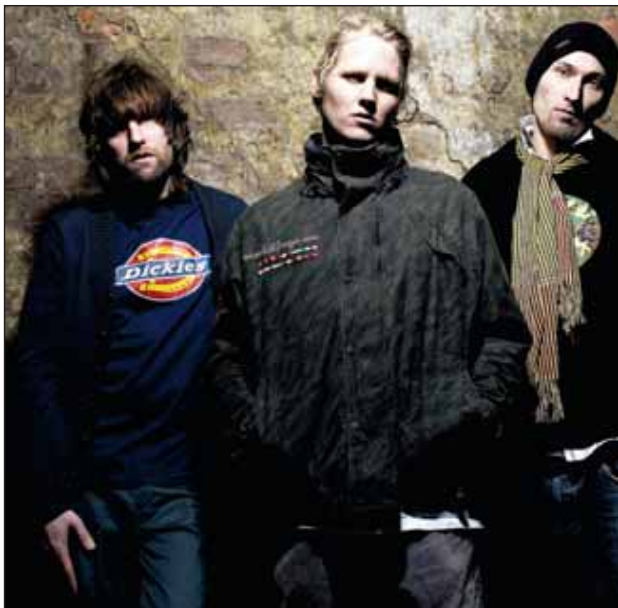
HARMONISK SAMARBEID: Selv om de tre gutta i Paperboys kommer fra ulike grupperinger innenfor musikk, går om at kvalitet er det viktigste. (Foto: Bomier Amigo Music).

Møller er kjent fra blant annet Euroboys som kan kategoriseres under soft-rock-musikk. Paperboys er derimot kjent for sin hip-hop-stil, men Vinni synes selv at gruppas musikk har utviklet seg, noe man kan høre på «The Oslo Agreement».