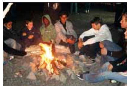
CAMPHYGGE: I fjor hygget mange seg ved leirbålet når de campet på festivalen. I år åpnes det for at mange flere kan gjøre det samme. (Foto: Kalbakken-klubben).

– Vi er Norges største rockeband, det er bare ikke alle som vet det ennå, smiler «Dr. S.» Bandet har et motto som lyder: «Ingenting er umulig!»