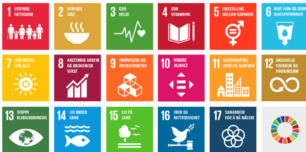
Fig. 1: FNs bærekraftsmål

Økologisk, økonomisk og sosial og kulturell bærekraft er faktorer som hver for seg er viktige for å nå bærekraftsmålene, men som til enhver tid må ses i sammenheng med hverandre og med de målsettinger vi arbeider for å nå. Vi har brukt tema fra bærekraftsmålene under hvert kapittel i kunnskapsgrunnlaget for Heim kommune.