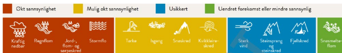
Fig. 2: Hva klimaendringer betyr for Trøndelag