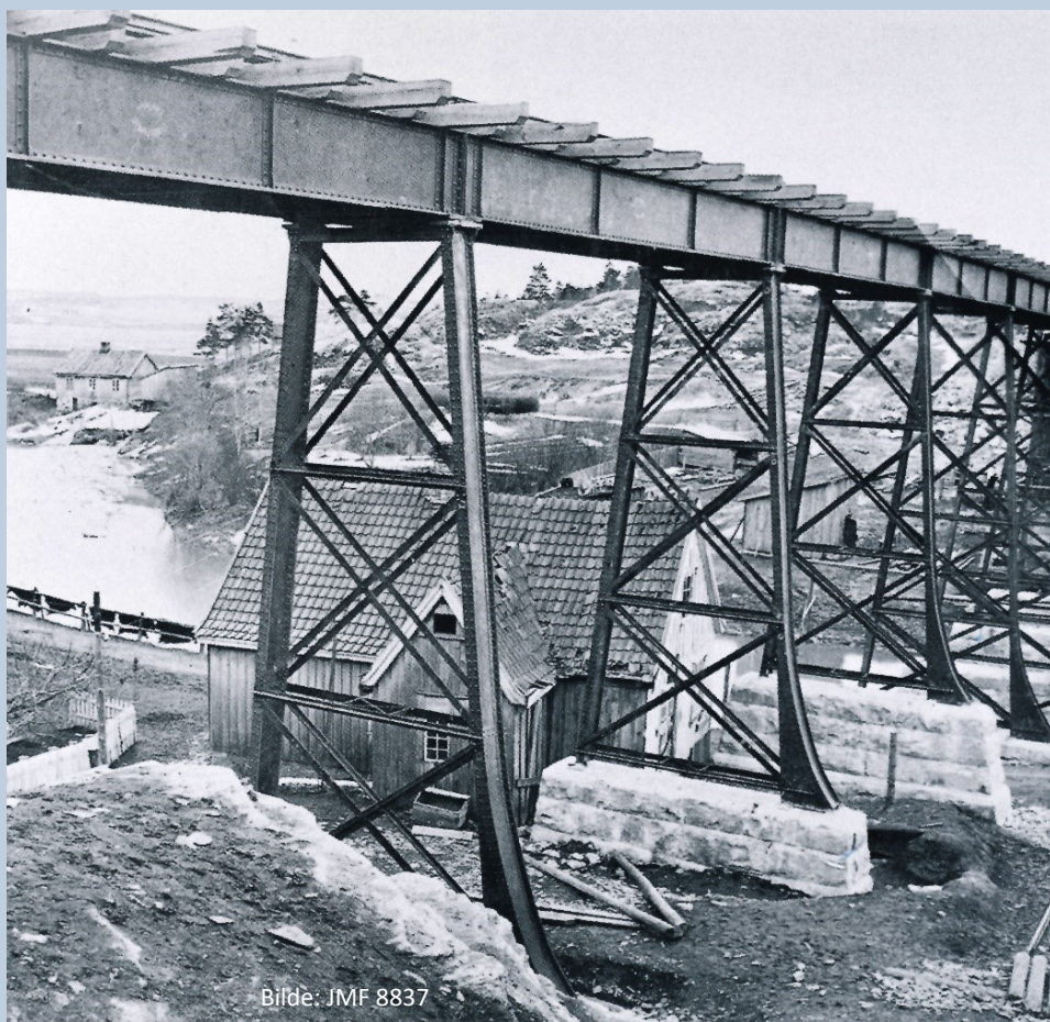
Bilde: JMF 8837

Siste ordinære rutetoget over Hølenviadukten gikk lørdag 21. september 1996 kl. 00.45.