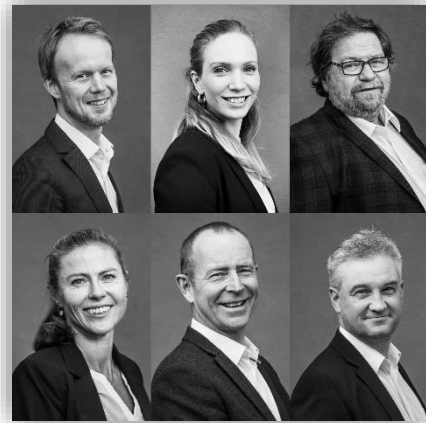
Medarbeiderne i LRV

Den løpende saksbehandlingen og oppfølgingen av Rådets vedtak ivaretas i all hovedsak av regionkoordinator i samarbeid med medarbeidere i Lillehammer-regionen Vekst (LRV), andre administrative ressurser i kommunene og regional kommunedirektørgruppe. LRV består ved inngangen til 2021 av fire faste stillinger som næringsutviklere, én fast stilling som regionkoordinator og én midlertidig stilling som regionmarkedsfører.