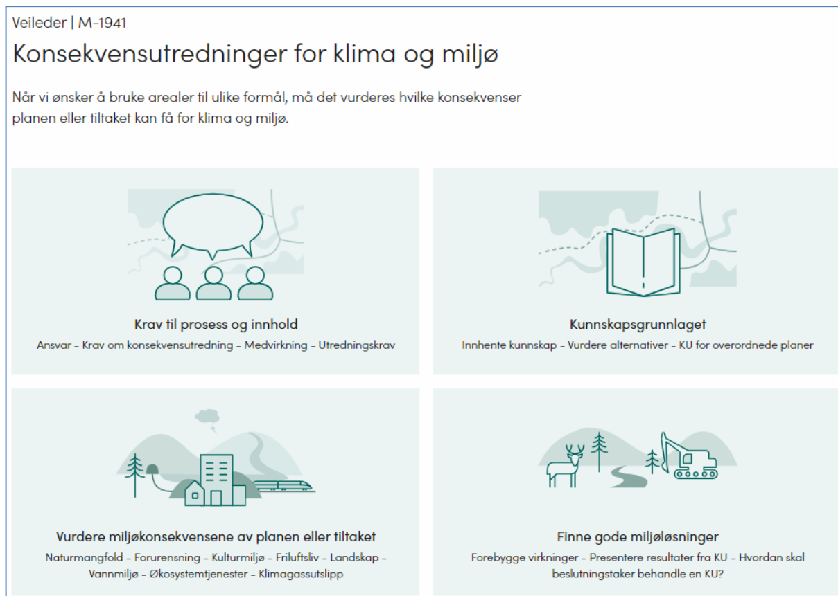
Figur 6.2-1: Forside til Veileder for konsekvensutredninger for klima og miljø på Miljødirektoratet sine hjemmesider https://www.miljodirektoratet.no/myndigheter/arealplanlegging/konsekvensutredninger/ .