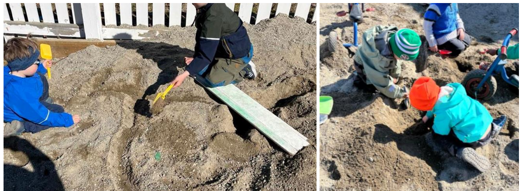
Bilde 1: Et badeland med mange sklier. To av skliene er for å fange tyver. Når de tramper på noe de tror er en vei, skli de ut i et eget basseng. Da blir det lett for politiet hente de. Bilde 2: Vi graver så dypt at vi kommer ned til lavaen. Det kan faktisk være en trollfelle.

Ellers er det utrolig fin lek og fine stunder i sanden. Sandområdet på fremsiden av barnehagen er stort, og det er plass til mange barn sammen. Vi gleder oss til vi får enda mer sand og boltre oss i. Vi har kjøpt inn nye sandleker som vi vet at mange vil få stor glede av.