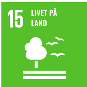
FNs bærekraftsmål 15 - Livet på land