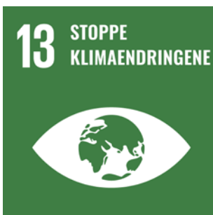
FNs bærekraftsmål 13 - Stopp klimaendringene