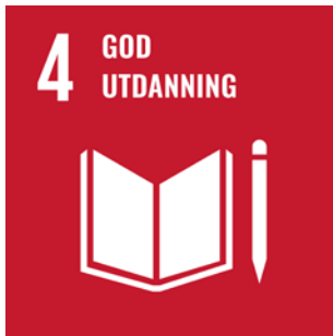
FNs bærekraftsmål 4 - God utdanning