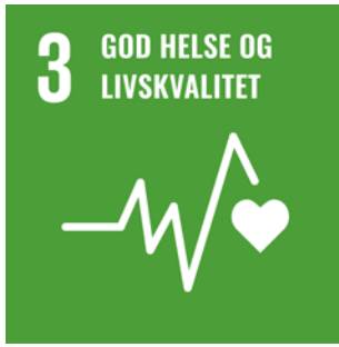
FNs bærekraftsmål 3 - God helse- og livskvalitet