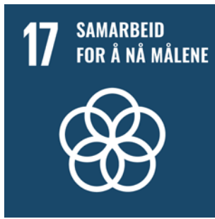
FNs bærekraftsmål 17 - Samarbeid for å nå målene