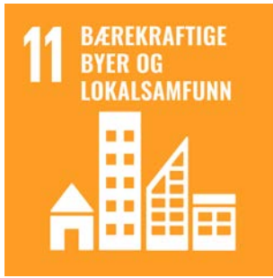
FNs bærekraftsmål 11 - Bærekraftige byer og lokalsamfunn