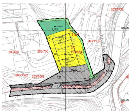
FIGUR 1: PLANKART

Området har adkomst fra Abaldalveien. Denne veien kobles på Fylkesveg 4148 som må anses som hoved adkomstveg til området. Fylkesveg 4148 har etablert fortau forbi planområdet innover i Rauli og helt ned til Circle K hvor vegen møter Fylkesveg 44. Fartsgrense langs vegen er 40 km/t.